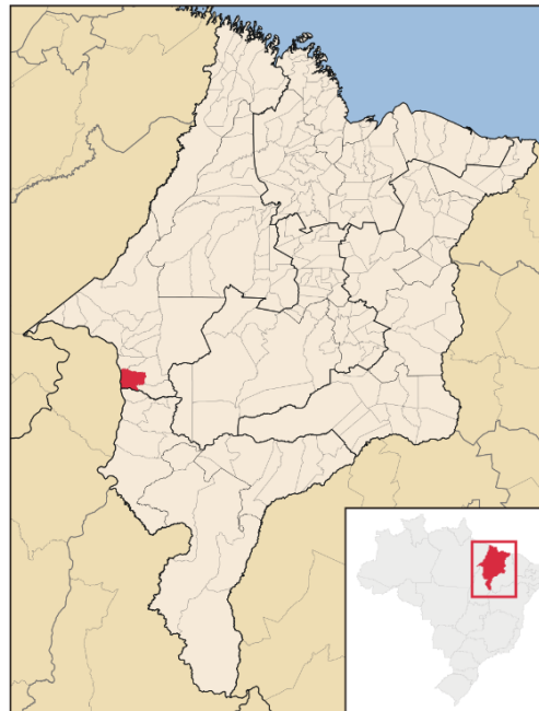
Figura 1 - Mapa de localização do Município de RIBAMAR FIQUENE/MA.